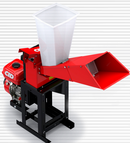
CID 125 à gasolina com polia e volante