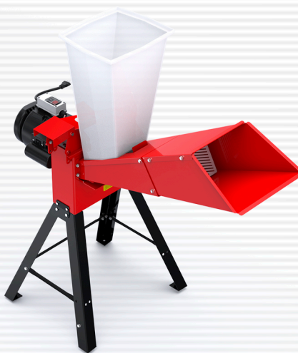
CID 105 elétrico motor direto