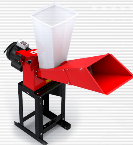
CID 125 elétrico motor direto