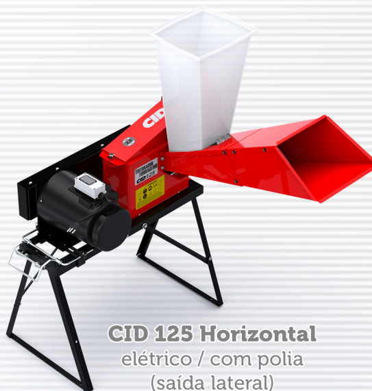
CID 125 Horizontal elétrico / com polia (saída lateral)