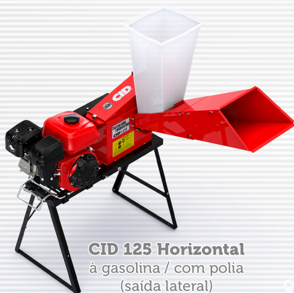
CID 125 Horizontal à gasolina / com polia (saída lateral)