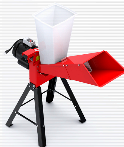
CID 75 elétrico motor direto